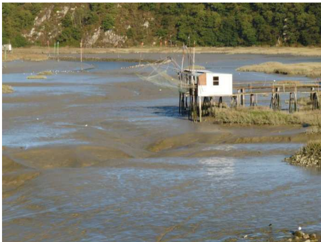
La Hisse : cabanes à carrelets sur la Rance

CIRCUIT 3: La Bretagne Romantique (126 km)