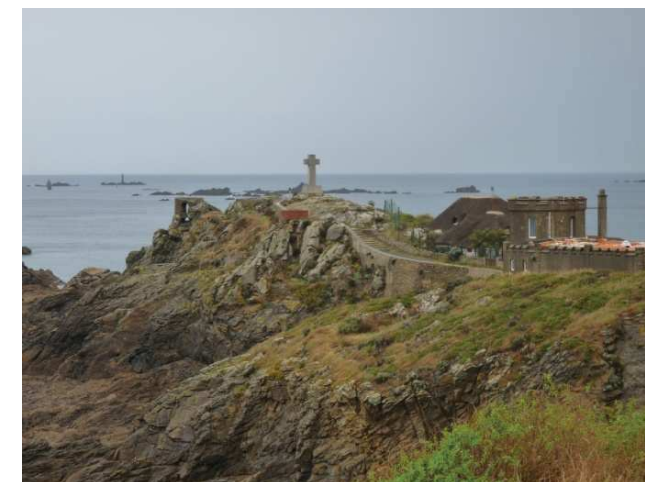
St-Lunaire: la pointe du Décollé

3 sites BPF-BCN : Cancale(35)- Combourg(35) – St-Cast-le-Guildo (22)