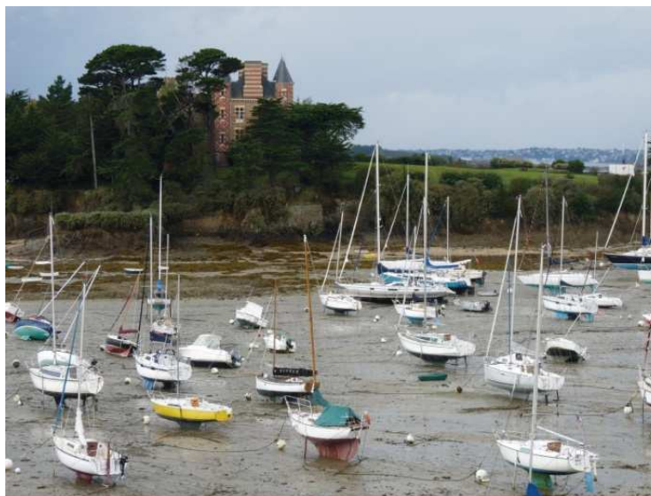
St Briac –sur-Mer