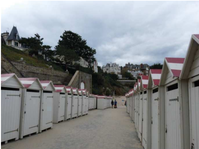
Cabines de plage et villas à St-Lunaire