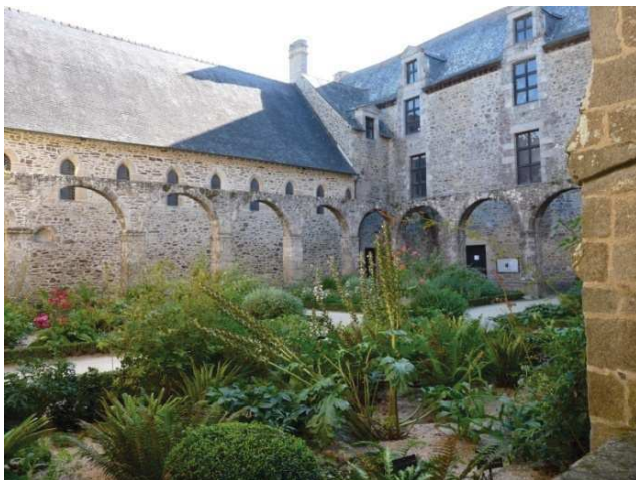
Le cloître de l'église prieurale de Léhon