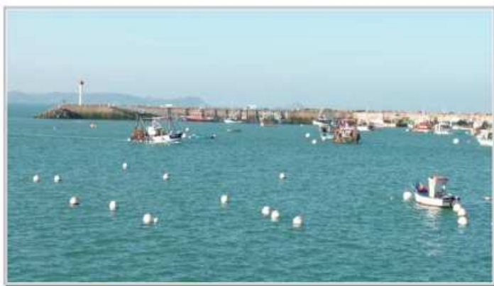
Le port d'Erquy

CIRCUIT N°2 : les collines du Méné (107 km)