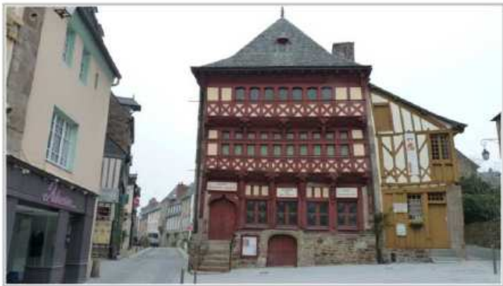
Lamballe, maison du bourreau

CIRCUIT N°1 : la côte de Penthièvre (107 km)