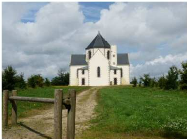
La chapelle Notre-Dame du Mont-Carmel (col du mont Bel-Air)