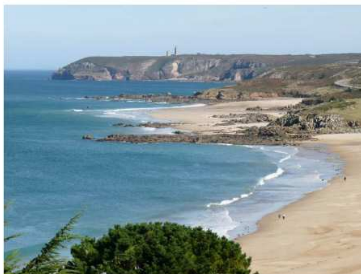
Pléhérel plage (Vieux-Bourg)