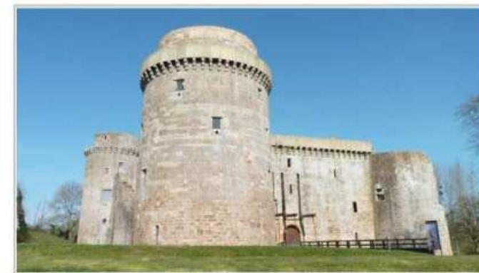
Château de la Hunaudaye